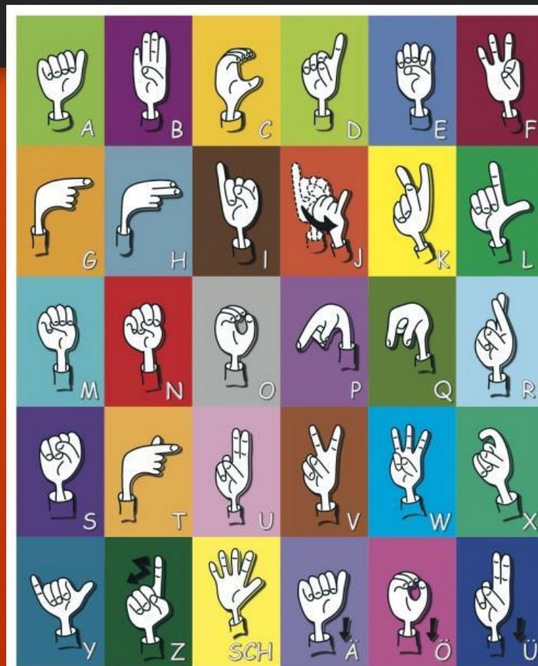
Fingeralphabet der Österreichischen Gebärdensprache