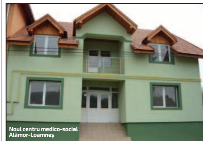
Noul centru medico-social Alâmor-Loamnes

Ioan Cindrea, președintele Consiliului Județean Sibiu. Pentru perioada 2015 - 2016, 6 primării au solicitat până acum programare pentru renovarea sau reabilitarea centrelor medico-sociale, în parteneriat cu Consiliul Județean: Arpașu de Jos pentru satul Nou Român, Porumbacu de Jos și Șeica Mică, iar trei pentru continuarea lucrărilor la Păuca,