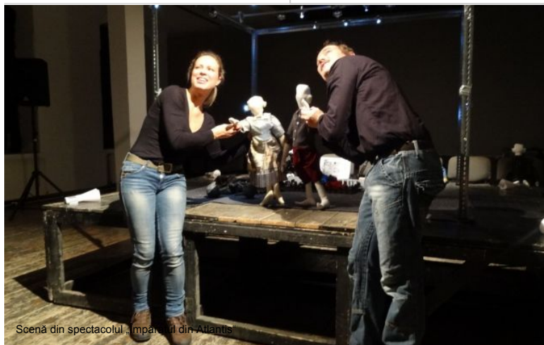
Scenă din spectacolul 'Imparatul din Atlantis'